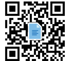
のぐち 高明 過去市政報告書一覧 Vol.1～ Vol.17