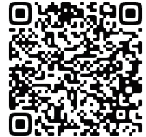
のぐち 高明 過去動画一覧

※右のQRコードを読み取ると、過去の私の一般質問の動画、ならびに過去の市政報告書が表示されます。通信料につきましては各自個人負担でお願いいたします。なお、動画はWi-Fi環境下での視聴をお勧めします。