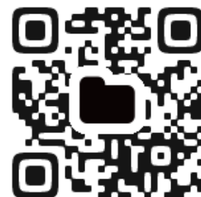
公共施設等総合管理計画 ポイント要約版